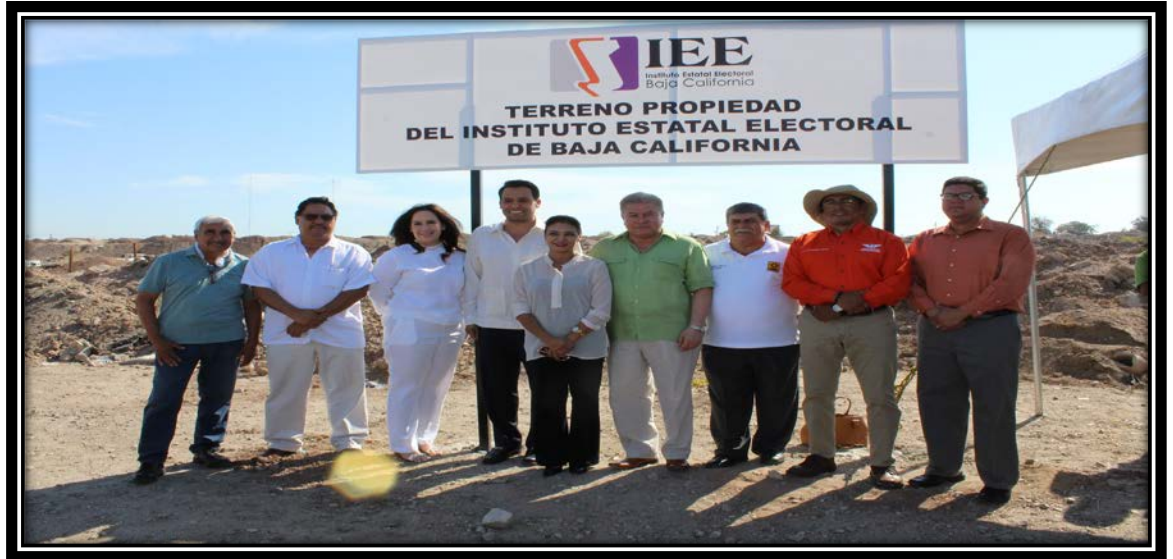
Fotografía tomada en la ciudad de Mexicali, B.C. 13 de julio de 2017

El referido contrato quedó inscrito en el Registro Público de la Propiedad y Comercio de esta Municipalidad, con las siguientes claves de identificación: