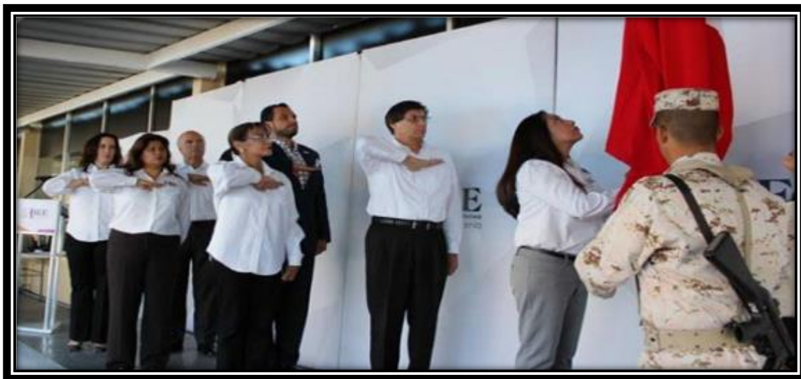
Fotografía tomada en la anterior sede del IEEBC 14 de febrero de 2017