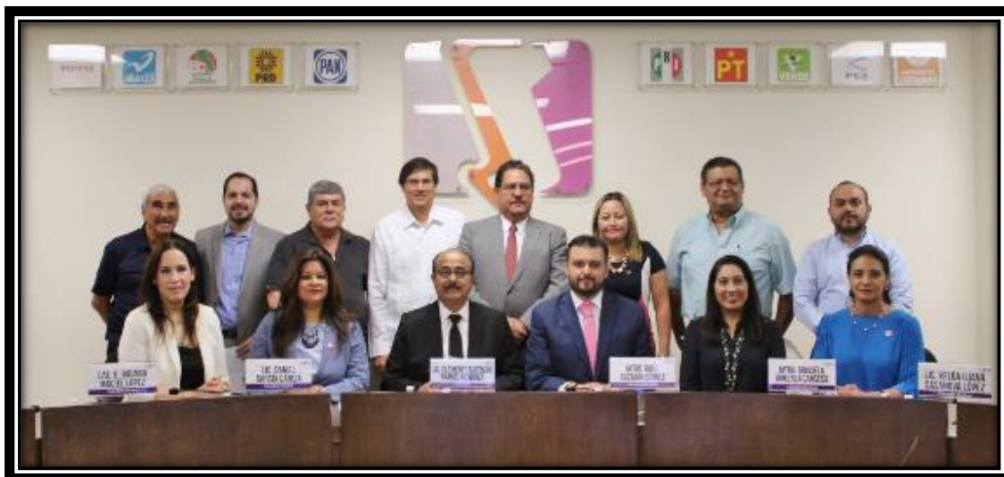
Fotografía tomada en la Sala de Sesiones del CGE 06 de octubre de 2017

Del 01 de noviembre al 31 de diciembre de 2016 se celebraron un total de 09 sesiones (02 ordinarias y 07 extraordinarias) del Consejo General del IEEBC.