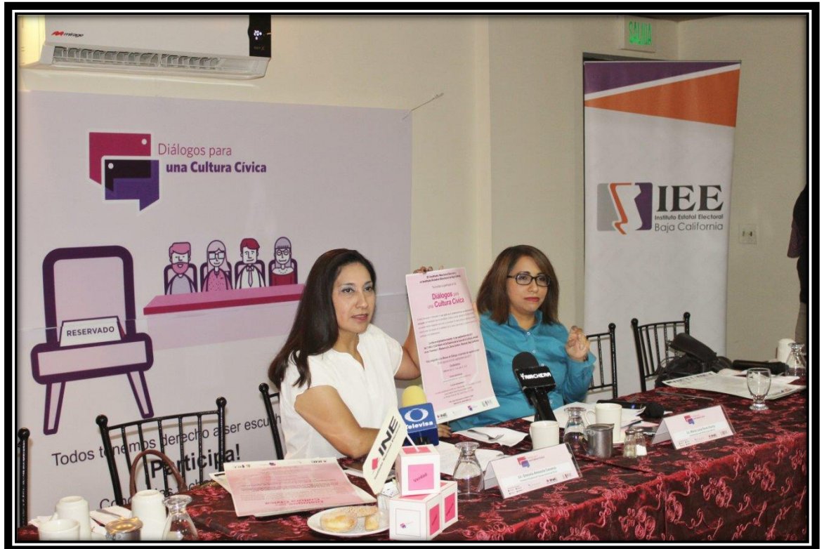
Fotografía tomada en la ciudad de Mexicali, B.C. 30 de agosto de 2017

El 28 de septiembre de 2017, se llevó a cabo la final del concurso de Debate Político en las instalaciones de la Cámara Nacional de Comercio "CANACO", en Mexicali, Baja California, participaron un total de 45 jóvenes, en tres categorías.