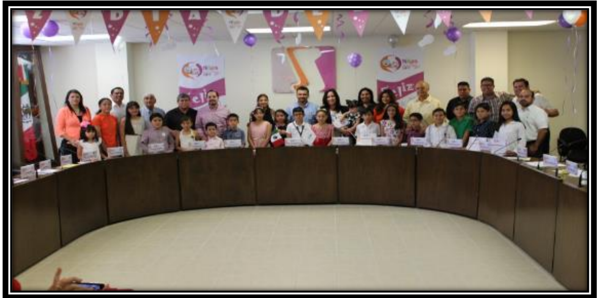
Fotografía tomada en la Sala de Sesiones del CGE 28 de abril de 2017