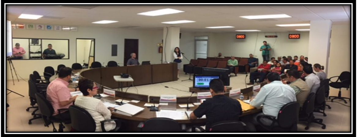
Fotografía tomada en la Sala de Sesiones del CGE 30 de marzo de 2017

Con base a lo anterior, el IEEBC obtuvo ingresos por la cantidad de $254,500.00 M.N., los cuales se encuentran bajo resguardo en las cuentas bancarias, pudiendo en todo caso ser utilizados previa autorización de las autoridades.