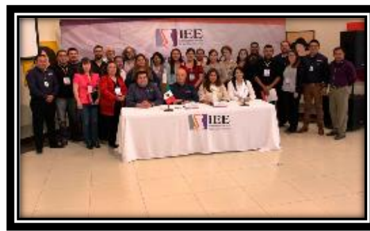
Fotografía tomada en la ciudad de Tecate, B.C. 20 de abril de 2017