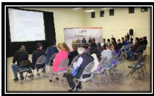
Fotografía tomada en la ciudad de Ensenada, B.C. 29 de marzo de 2017