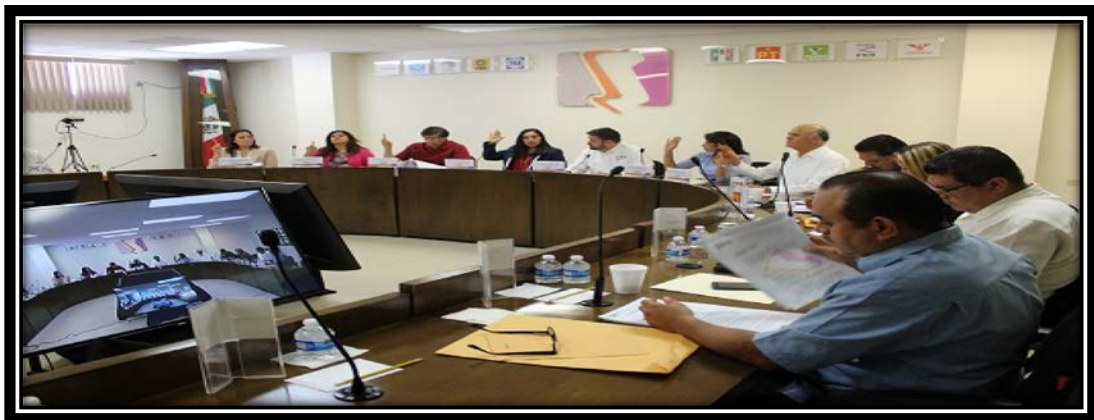
Fotografía tomada durante la VIII Sesión Ordinaria en la Sala de Sesiones del CGE 17 de agosto de 2017