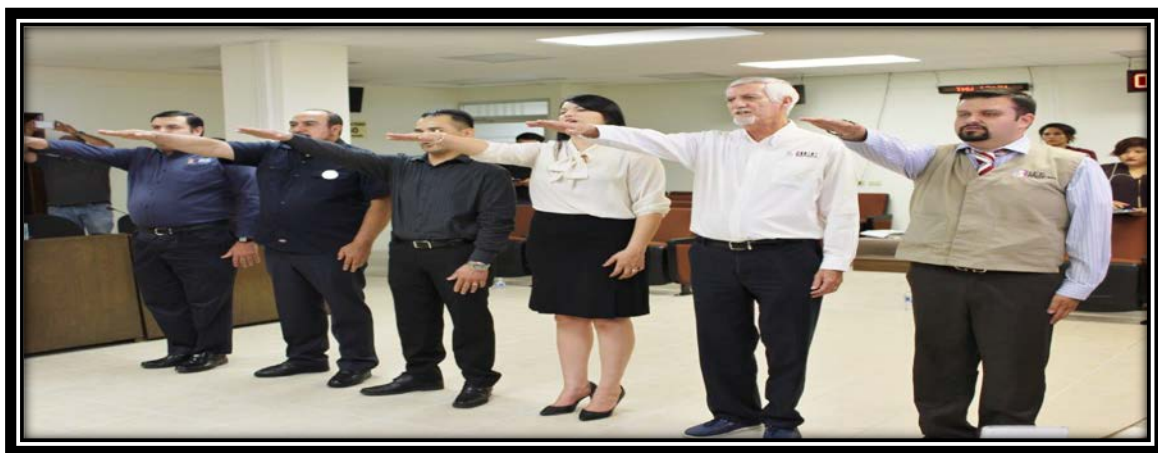
Fotografía tomada en la Sala de Sesiones del CGE 18 de mayo de 2017