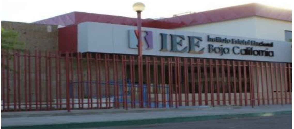
Fotografía tomada en el exterior de la sede del IEEBC en la ciudad de Mexicali, B.C. Junio de 2017

Avenida Rómulo O'Farril # 938 Centro Cívico y Comercial C.P. 21000 Mexicali, Baja California Tel. (686) 568 4176 www.ieebc.mx