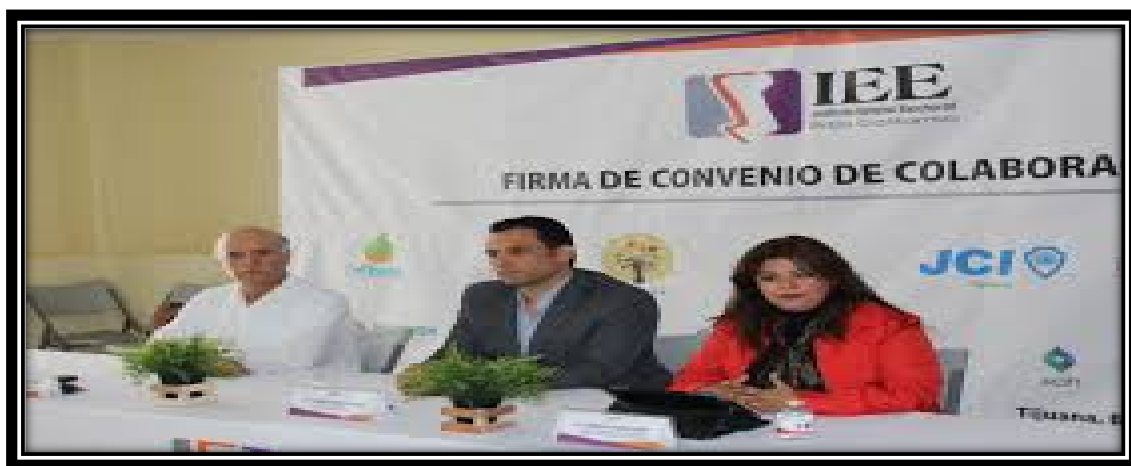
Fotografía tomada en la ciudad de Tijuana, B.C. 31 de marzo de 2017