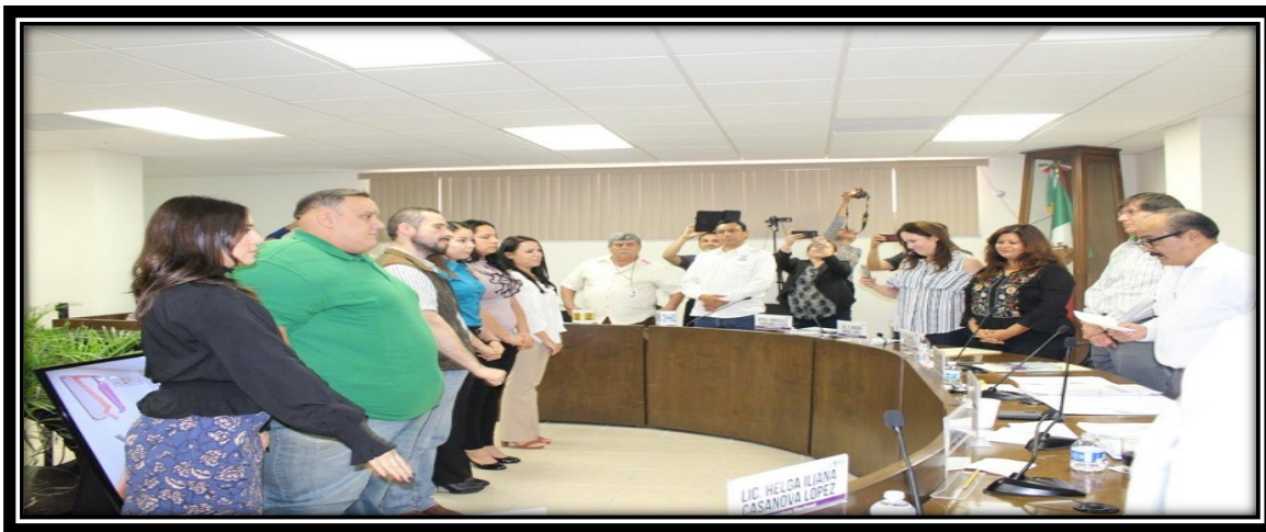
Fotografía tomada en la Sala de Sesiones del CGE 31 de octubre de 2017

En consecuencia de lo anterior, el 31 de octubre de 2017 el Consejo General del IEEBC realizó las designaciones y entrega de los nombramientos correspondientes.