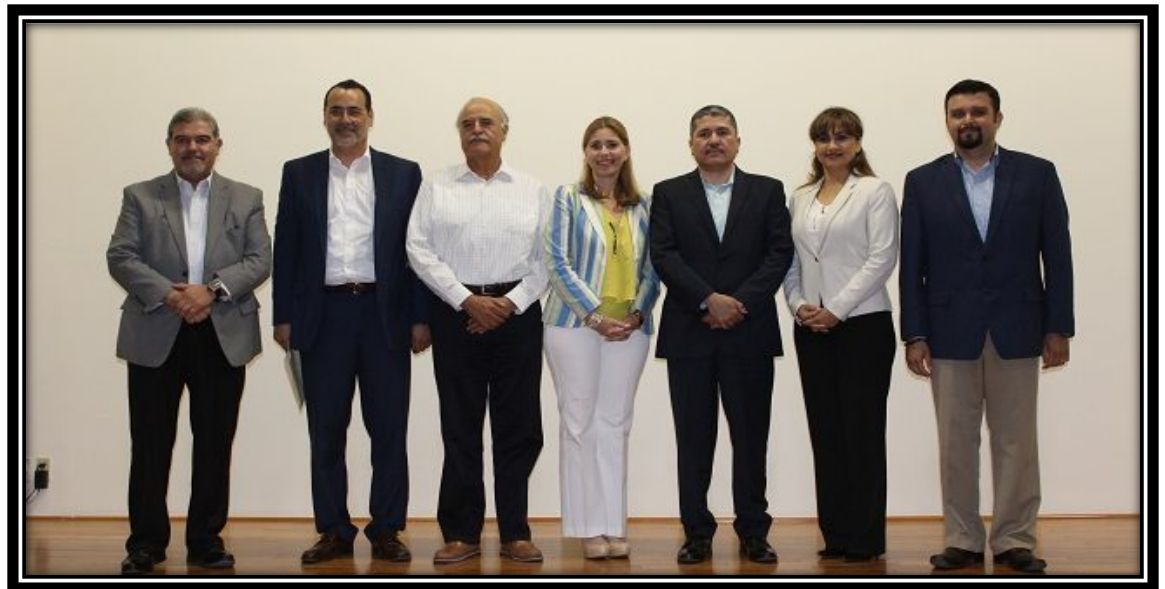
Fotografía tomada en la ciudad de Tijuana, B.C. 31 de marzo de 2017