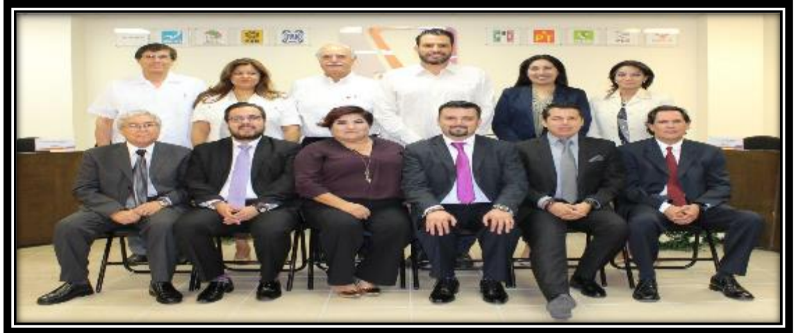
Fotografía tomada en la Sala de Sesiones del CGE 28 de junio de 2017

Para efecto de ilustración, se presenta un recuadro con el resumen estadístico de acuerdo del Consejo General del IEBC: