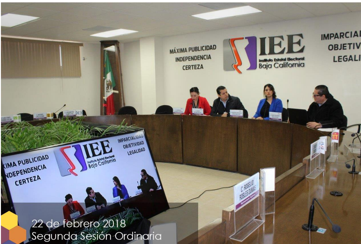
22 de febrero 2018 Segunda Sesión Ordinaria