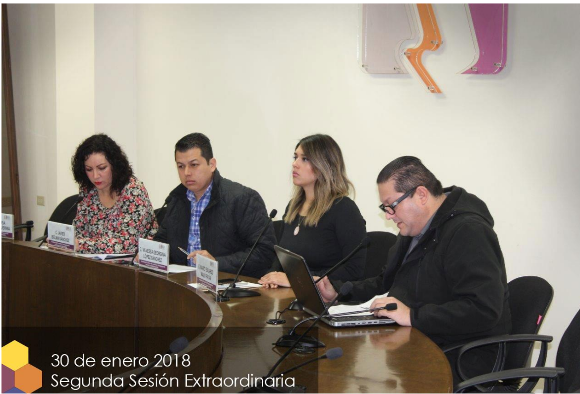
30 de enero 2018 Segunda Sesión Extraordinaria