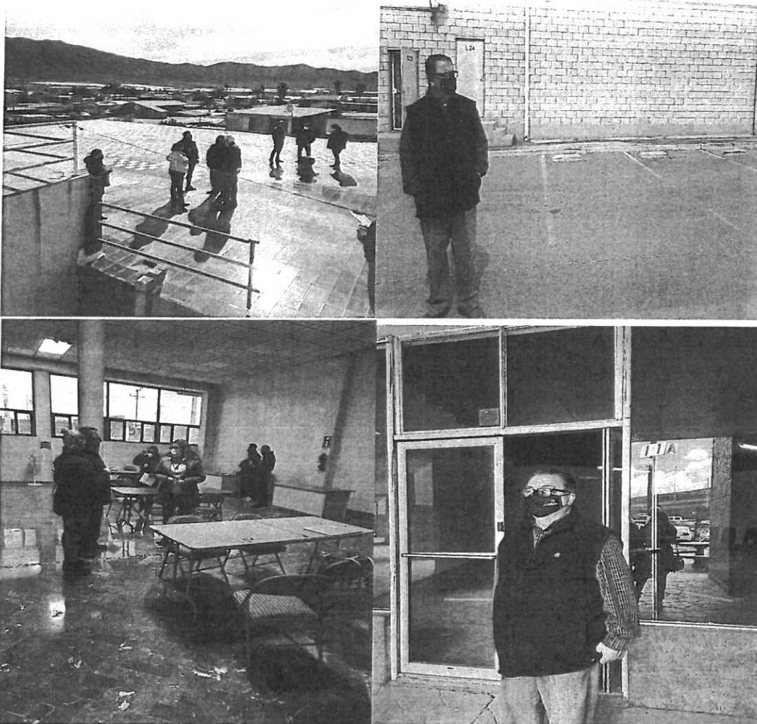
Recorrido a las sedes Distritales en Zona Costa los días 12 y 13 de marzo del 2021