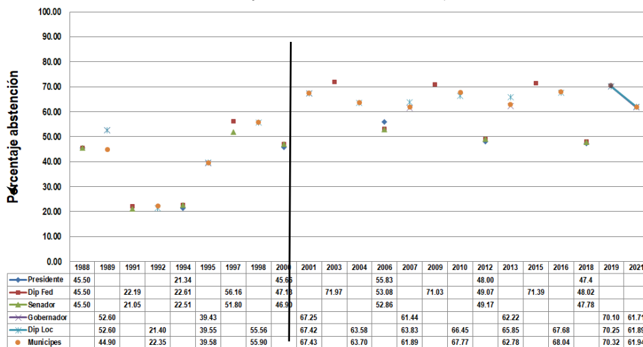
Tendencia de la abstención política electoral en Baja California, 1988/2021

Fuente: Coutigno, A. (2017). Baja California, elecciones 2016. En Los Estados en 2016. Nuevos equilibrios regionales. México: Universidad Nacional Autónoma de México.